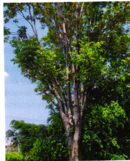
Imagen 1 y 2. Individuo arbóreo motivo de denuncia.

Medellín 202, piso 4, colonia Roma Norte Alcaldía Cuauhtémoc, C.P. 06700, Ciudad de México Tel. 5265 0780 ext 12011 y 12400