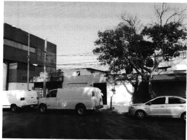
Imágenes 1,2. Imágenes del predio donde se encontraba el supuesto individuo arbóreo.

En seguimiento a la investigación, personal adscrito a esta Procuraduría realizó un estudio espacio temporal del año 2017 al 2021 con base en la interpretación visual de imágenes de satélite y fotografías a nivel de calle, con la finalidad de identificar indicios de la existencia de un árbol en el interior del predio referido en el escrito de denuncia, de donde se desprende que durante el periodo de tiempo mencionado no se constató la existencia de algún individuo arbóreo dentro del predio; debido a lo anterior se descarta cualquier derribo.