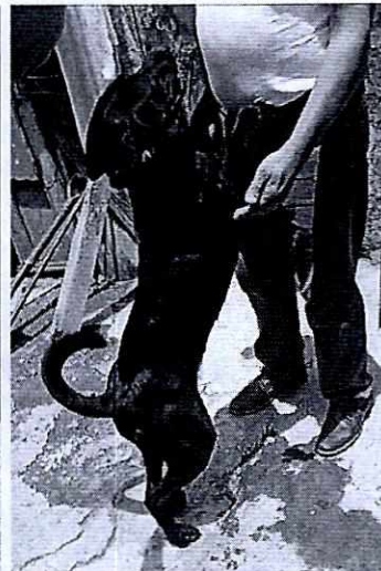
Fotografías 1, 2 y 3. Se muestran a los dos ejemplares caninos hembras raza french poodle, a la hembra raza pitbull y a la hembra raza criolla.