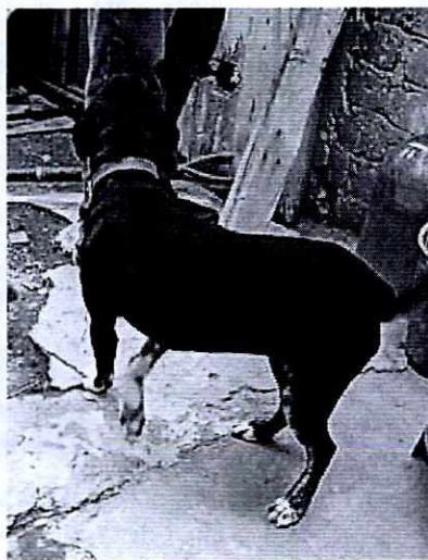
Fotografías 4 y 5. Se muestran al ejemplar canino macho raza criolla y a la hembra raza criolla.