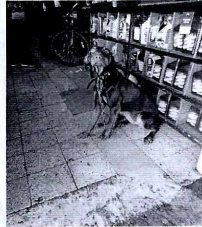
Fotografías 1-3. Ejemplares caninos motivo de la denuncia.

Por lo que hace a los hechos denunciados, se constató que los ejemplares permanecían amarrados de manera permanente, con cadenas de metro y medio, lo cual no les permitía desplazarse lo suficiente, debido a que el espacio donde permanecían se encontraba muy reducido, por lo que se le exhortó al responsable de los ejemplares a realizar adecuaciones al respecto, tales como alargar la correa, adaptar el lugar de alojamiento, colocarles collares o pecheras en lugar de collares de castigo, esto con