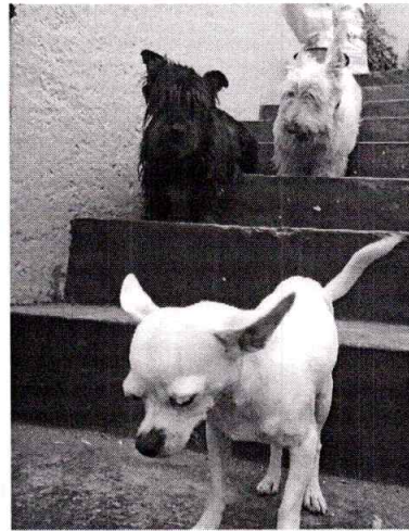
Fotografía 1.- En la imagen se observa a los caninos motivo de denuncia "Italo" (blanco), "Hanny" (negro) y Charlotte (chihuahua).

En seguimiento a la denuncia, la persona responsable de los caninos, estableció comunicación con el personal de esta Entidad y mediante aplicación instantánea para teléfonos inteligentes envió como pruebas, imágenes fotográficas los 3 ejemplares caninos de nombres Italo, Hanny y Charlotte (Chihuahua) con los que cuenta y de las condiciones de bienestar animal que les brinda, donde se observa, que cuenta con agua y croquetas, con una condición corporal ideal, la presencia de una casa para perro que los protege contra la intemperie y se observan libres en el patio y cuentan con su cartilla de vacunación respectiva.