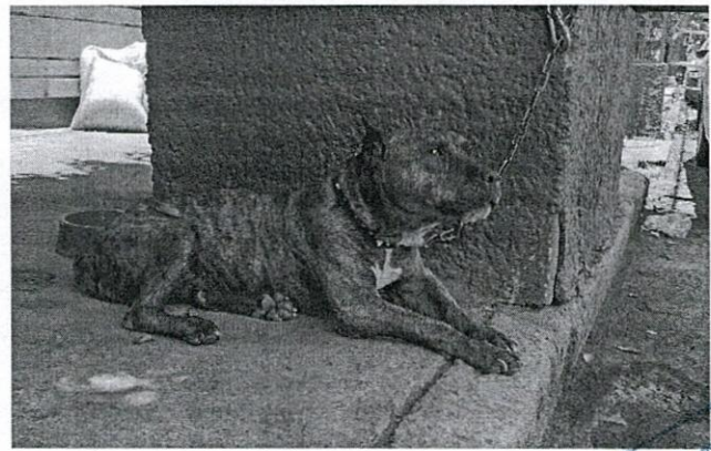
Figuras 1 y 2. Ejemplar canino que responde al nombre de "Morgan".

Derivado de lo observado se realizaron las siguientes recomendaciones: