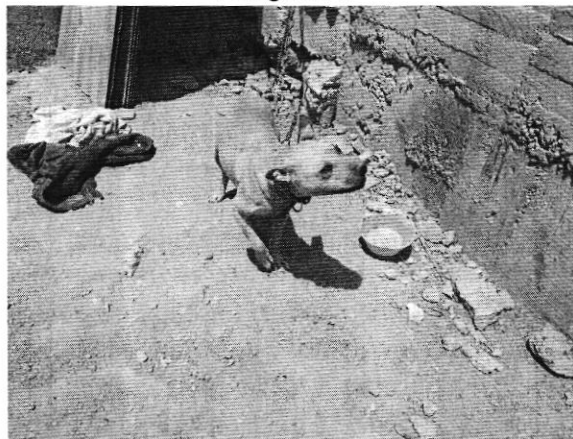
Imagen del ejemplar canino y su alojamiento.

En virtud de lo antes expuesto, esta Entidad considera procedente emitir la presente resolución, de conformidad con el artículo 27 fracción VI de la Ley Orgánica de esta Procuraduría, por imposibilidad legal, al no constatar irregularidades en materia de bienestar animal.