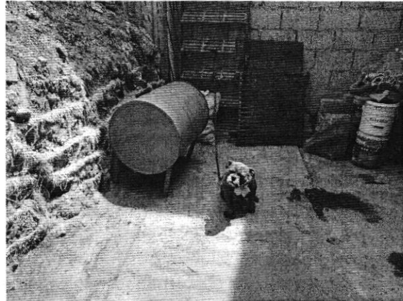
Imagen del ejemplar canino y su alojamiento.