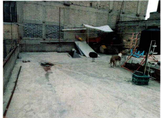
Fotografía 1.- Se observa el canino “Mia” y su sitio de alojamiento.

Es de resaltar que, en el Acuerdo de Admisión, que fue enviado por correo electrónico a la persona denunciante, se le hizo de conocimiento que contaba con un término de seis días hábiles para aportar las pruebas que estimara pertinentes en la investigación de los hechos, lo anterior conforme al artículo 90 del Reglamento de la Ley Orgánica de la Procuraduría Ambiental y del Ordenamiento Territorial de la Ciudad de México; sin embargo, durante el procedimiento de investigación, no fueron proporcionados elementos de prueba que pudieran determinar incumplimiento a la normatividad en materia de bienestar animal.