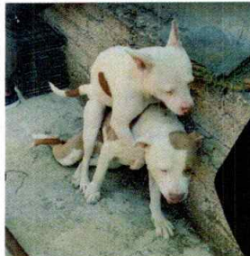
En la imagen se aprecia a los caninos "Luna" y "Mia".