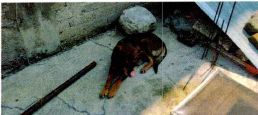
En la imagen se aprecia al canino de nombre chocolate.