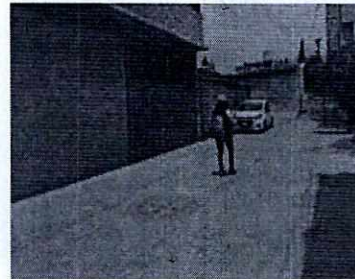
Imágenes 1 y 2. Calle referida en el escrito de la denuncia

A efecto de aportar mayores elementos de los hechos denunciados, fue enviado por correo electrónico a la persona denunciante el Acuerdo de Admisión, mediante el cual se le hizo de conocimiento que contaba con un término de seis días hábiles para aportar las pruebas que estimara pertinentes en la investigación de los hechos, lo anterior conforme al artículo 90 del Reglamento de la Ley Orgánica de la Procuraduría Ambiental y del Ordenamiento Territorial de la Ciudad de México; sin embargo durante el procedimiento de investigación, no fueron proporcionados elementos de prueba que pudieran determinar incumplimiento a la normatividad en materia de bienestar animal.