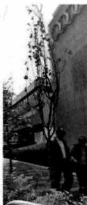
Figuras 3-5. Vista de los tres individuos arbóreos que no sobrevivieron al trasplante, observándose secos.

Asimismo, el representante legal mostró copia simple del oficio con número de folio DDU/1182/2018 signado por el Director de Desarrollo Urbano, adscrito a la Dirección General de Obras, Desarrollo Urbano y Servicios Públicos de la Alcaldía Benito Juárez, mediante el cual se autoriza la reparación de la banqueta localizada frente al predio ubicado en Avenida Insurgentes Sur número 1572, colonia Crédito Constructor, de esa demarcación territorial; así como el escrito presentado a la Dirección General de Evaluación de Impacto y Regulación Ambiental con fecha de presentación 11 de enero de 2019, mediante el cual se informa el cumplimiento al Resolutivo Tercero del Acuerdo Administrativo del 6 de noviembre de 2018 señalado anteriormente, mismo que cuenta con el anexo fotográfico de los trabajos de trasplante.