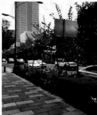
Figuras 1-2. Se observa la superficie donde se retiró área verde para la modificación de la banqueta, así como los árboles que fueron trasplantados en el área verde colindante.