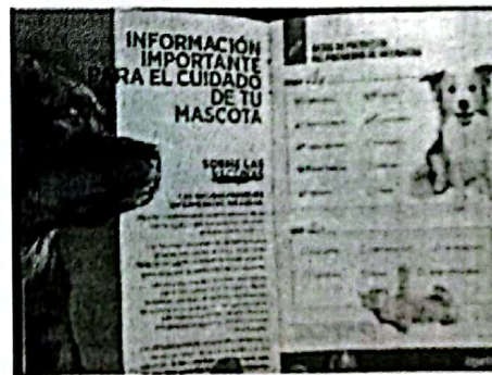
Imágenes 3 y 4. Cartilla de vacunación del ejemplar canino

En virtud de lo antes expuesto, esta Entidad considera procedente emitir la presente resolución, de conformidad con el artículo 27 fracción VI de la Ley Orgánica de esta Procuraduría, por imposibilidad legal, al no constatar irregularidades en materia de bienestar animal.