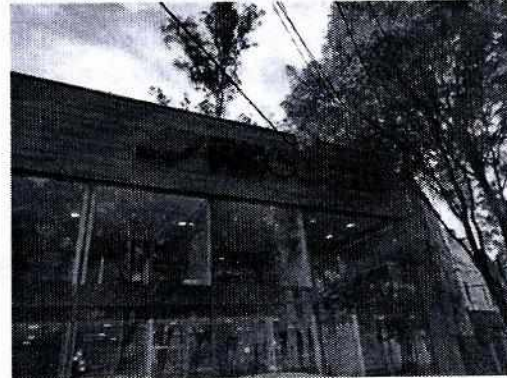
Fotografías 1 y 2: Las imágenes muestran al fachada del establecimiento mercantil motivo de la denuncia.

En atención a la denuncia, se desprende que personal de esta Subprocuraduría realizó cuatro reconocimientos de hechos, de conformidad con el artículo 15 BIS 4 fracción IV de la Ley Orgánica de esta Entidad, diligencias en las cuales se constató la existencia de un establecimiento mercantil de nombre comercial "Recubre", mismo que se encontraba abierto y en funcionamiento, donde no se constató la generación de emisiones sonoras generadas por sus actividades.