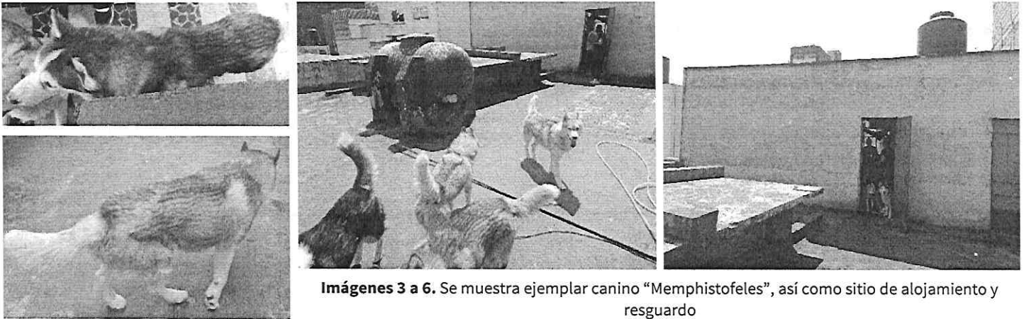
Imágenes 3 a 6. Se muestra ejemplar canino "Memphistofeles", así como sitio de alojamiento y resguardo

Es de resaltar que, con el propósito de conocer mayor información respecto de los hechos denunciados, en el Acuerdo de Admisión, que fue enviado por correo electrónico a la persona denunciante, se le hizo de conocimiento que contaba con un término de seis días hábiles para aportar las pruebas que estimara pertinentes en la investigación de los hechos, lo anterior conforme al artículo 90 del Reglamento de la Ley Orgánica de la Procuraduría Ambiental y del Ordenamiento Territorial de la Ciudad de México; sin embargo durante el procedimiento de investigación, no fueron proporcionados elementos de prueba que pudieran determinar incumplimiento a la normatividad en materia de bienestar animal.