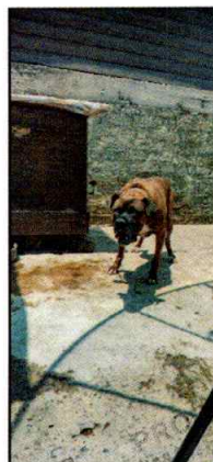
Fotografías 1 y 2.- Se observa al canino de nombre "Tigre"

En seguimiento a la denuncia, se tuvo comunicación con el propietario del canino quien mediante aplicación móvil para teléfonos inteligentes, envió evidencia de las condiciones de bienestar animal de su canino, el cual se aprecia que el canino se encuentra libre en dicho sitio.