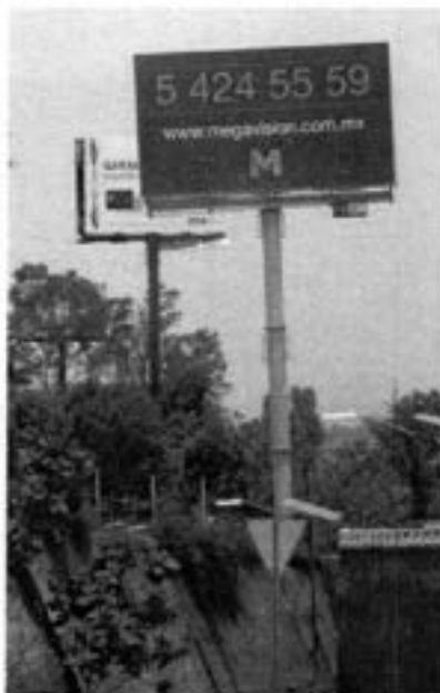
ANUNCIO AUTOSOPORTADO 2