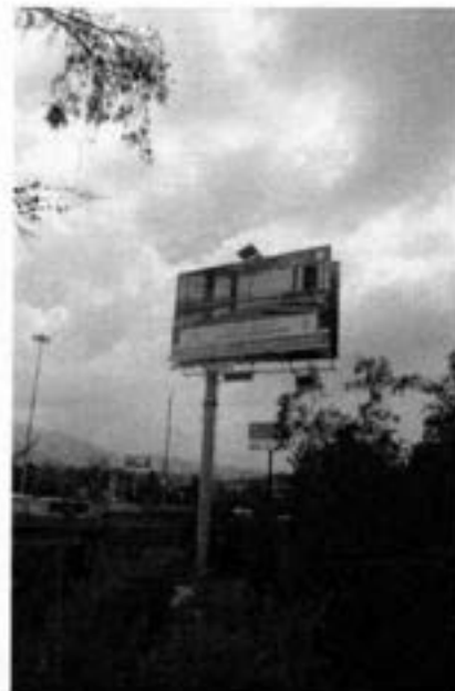
ANUNCIO AUTOSOPORTADO 3