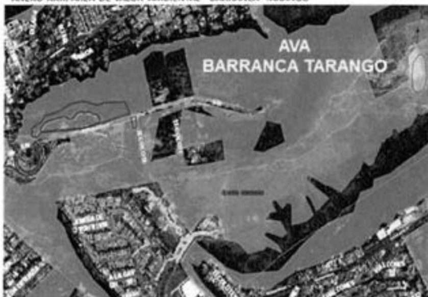
ANEXO XXII. ÁREA DE VALOR AMBIENTAL "BARRANCA TARANGO"