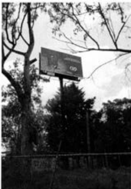
ANUNCIO AUTOSOPORTADO 1