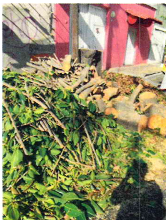
Imagen 9. Se muestra tocón y esquilmos producto del derribo del sujeto arbóreo ubicado en el sitio 4.

Es decir para poder identificar posibles violaciones a la normatividad en materia ambiental, se realizó un análisis comparativo, tomando como primer parámetro las fotografías aportadas como prueba por parte de la persona denunciante, referentes al estado en que los árboles resultaron tras haber sido sometidos a las intervenciones motivo de denuncia; y, como segundo parámetro las imágenes históricas del portal de internet denominado "Google maps", en las que se muestra el estado anterior