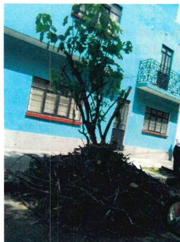
Imagen 7. Se muestra estado actual del sujeto arbóreo ubicado en el sitio 3.

Sitio 4. Sujeto arbóreo de la especie comúnmente conocida como hule ubicado frente al inmueble marcado con el número 164 en Calle 7, colonia Porvenir.