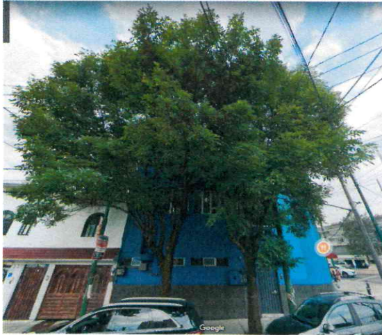
Imagen 1. Se observan dos individuos arbóreos ubicados en el sitio 1. Imagen fechada del mes de abril de 2022

Sitio 1. Dos sujetos arbóreos de la especie comúnmente conocida como fresno, ubicados sobre Calle Norte 83, esquina Calzada Camarones, colonia Sindicato Mexicano de Electricistas.