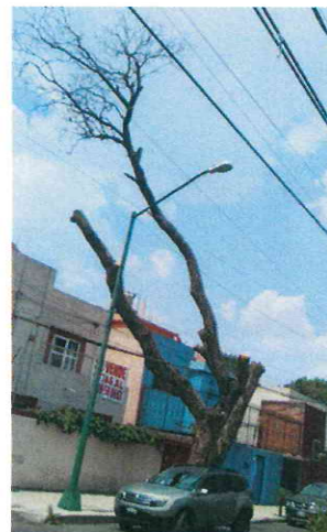
Imagen 5. Se muestra estado actual del sujeto arbóreo ubicado en el sitio 2.

Sitio 3. Sujeto arbóreo de la especie comúnmente conocida como Colorín ubicado frente al inmueble marcado con el número 77 en calle Palestina, colonia Clavería.