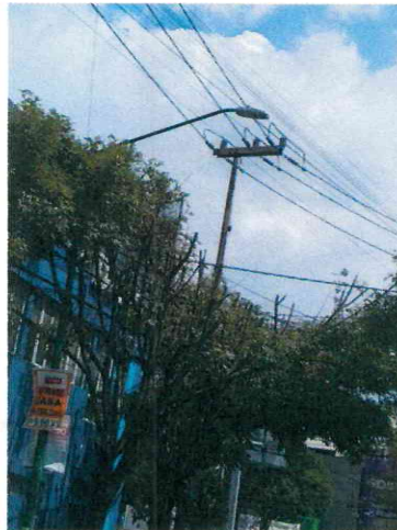
Imágenes 2 y 3. Se muestra estado actual de los sujetos arbóreos ubicados en el sitio 1.