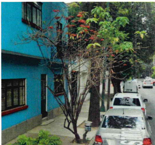
Imagen 6. Se observa un individuo arbóreo ubicado en el sitio 3. Imagen fechada del mes de abril de 2019