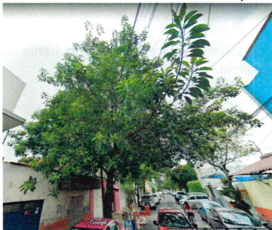
Imagen 8. Se observa un individuo arbóreo ubicado en el sitio 4. Imagen fechada del mes de abril de 2022

Sitio 4. Sujeto arbóreo de la especie comúnmente conocida como hule ubicado frente al inmueble marcado con el número 164 en Calle 7, colonia Porvenir.