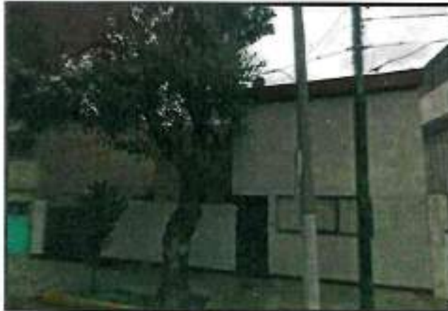
Fuente: captura de Street View de octubre de 2008.

correspondiente del mes de enero de 2016 a la actualidad el cuerpo constructivo cambio su uso, para ser aprovechado como un establecimiento mercantil con giro de refaccionaria.