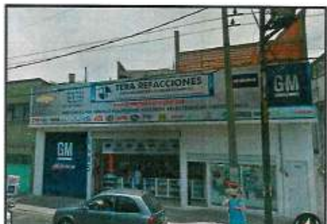
Fuente: captura de Street View de julio de 2019.

Imagen No. 3 Inmueble de 2 niveles con establecimiento mercantil con giro de refaccionaria con la denominación "TERA REFACCIONES".