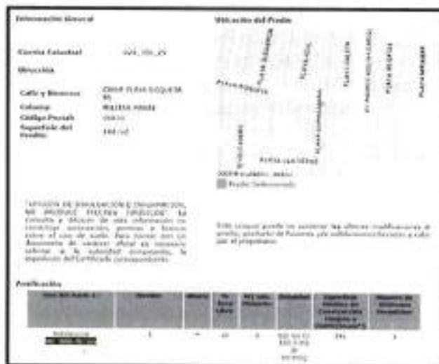
Imagen: Consulta del predio en el Sistema de Información Geográfica de la Secretaría de Desarrollo Urbano y Vivienda de la Ciudad de México