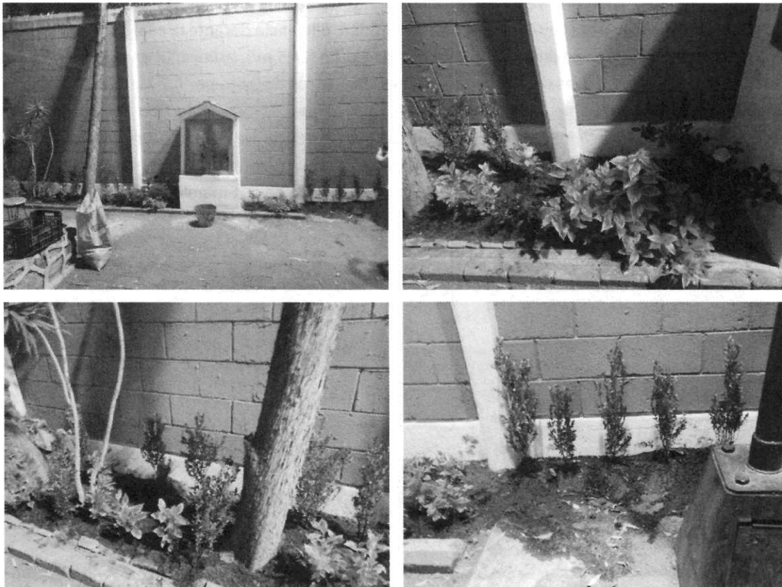
Imágenes 3 a 6. Vista general de la jardinera después de su recuperación.

Derivado de lo antes señalado, mediante la promoción de cumplimiento voluntario de las disposiciones ambientales en la materia que nos ocupa, la persona señalada como presunta responsable de los hechos denunciados, informó a esta Entidad haber realizado la compensación correspondiente de la superficie de área verde afectada de 0.665 m 2 , al haber recuperado la superficie de biomasa de 23.835 m 2 restantes de la jardinera en comento, mediante la colocación de tierra y plantas arbustivas en dicho sitio.