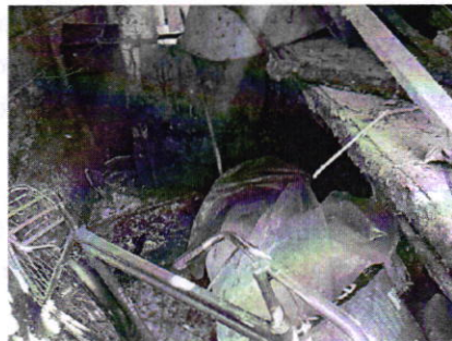
Fotografía 2. Sitio en el cual anteriormente se encontraban los porcinos.

En seguimiento a la denuncia, se realizó un nuevo reconocimiento de hechos por personal adscrito a esta Subprocuraduría, en el cual se constató que derivado del cumplimiento voluntario por parte de la persona propietaria del inmueble en comento, fueron retirados del sitio los nueve porcinos.