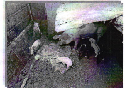
Fotografía 1. Vista de los porcinos presentes en el sitio referido en el escrito de denuncia.

Personal de esta Subprocuraduría realizó un reconocimiento de hechos de acuerdo a lo establecido en el artículo 15 BIS 4 fracción IV de la Ley Orgánica de esta Entidad, en el cual se constató la existencia de nueve porcinos (dos adultos y tres lechones), localizados en el patio del inmueble en comento, en un espacio techado y construido con ladrillos grises, el cual tiene una superficie aproximada de 4 m 2 .