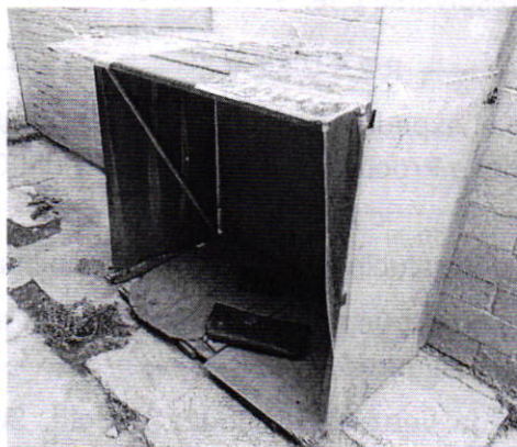
Fotografía 2. Vista del sitio de alojamiento del ejemplar canino motivo de denuncia.

En seguimiento a la denuncia, se realizó un reconocimiento de hechos por personal adscrito a esta Subprocuraduría, durante el cual se constató que derivado del cumplimiento voluntario por parte de la persona propietaria del animal de compañía que responde al nombre de "Canela", fue construido su sitio de alojamiento, con la colocación de una lámina acanalada de aluminio, cubierta en su extremos con tablas de madera de triplay, de igual manera en la parte inferior presenta una tarima para evitar el contacto directo con el piso, dicho espacio le permite protegerse de las inclemencias del tiempo.