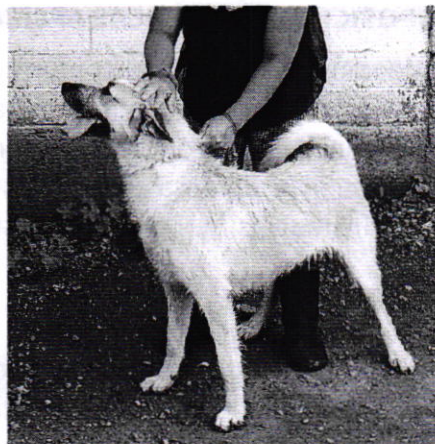
Fotografía 1. Vista del ejemplar canino que responde al nombre de "Canela".