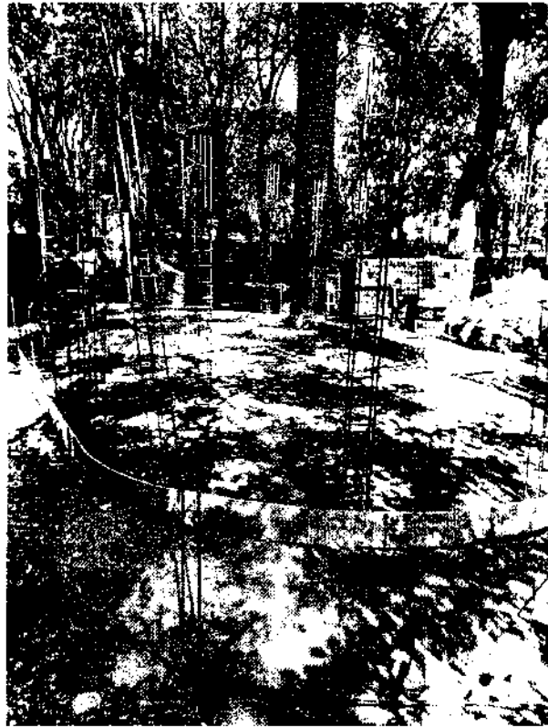
Fotografía 1. Superficie ocupada para la edificación del módulo de seguridad.

PROCURADURÍA AMBIENTAL Y DEL ORDENAMIENTO TERRITORIAL DE LA CIUDAD DE MÉXICO SUBPROCURADURÍA AMBIENTAL DE PROTECCIÓN Y BIENESTAR A LOS ANIMALES