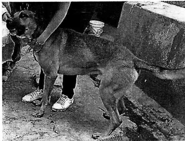
Fotografías 1 y 2. Se muestra sitio de alojamiento y ejemplar canino motivo de la presente investigación.