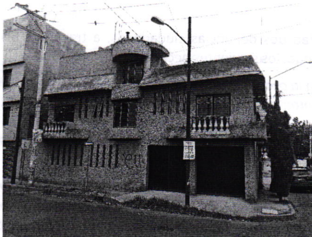
Fotografía 1. Vista del inmueble referido en el escrito de denuncia.

En este sentido, personal de esta Subprocuraduría realizó cuatro reconocimientos de hechos de acuerdo a lo establecido en el artículo 15 BIS 4 fracción IV de la Ley Orgánica de esta Entidad, durante los cuales no se constataron los hechos motivo de denuncia, toda vez que desde el espacio público, no se constató la existencia de algún ejemplar canino, ladridos provenientes del interior del inmueble en comento u olores característicos de la presencia de dichos animales.