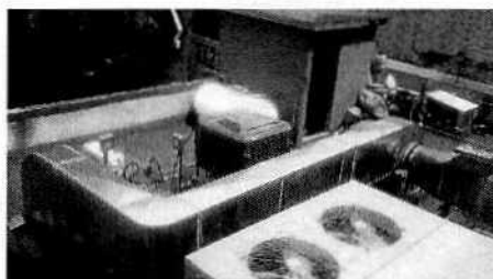
Se muestra el sistema de extracción con las adecuaciones realizadas.

En seguimiento a lo anterior, personal de esta Entidad realizó un último reconocimiento de hechos, en el cual se constató que en cumplimiento voluntario se llevaron a cabo las medidas de mitigación consistentes en el cambio de filtros, limpieza de ductos, colocación de tornillería faltante, sellado de grietas en lámina de ductos y ampliación del tiro del ducto, por lo que ya no se percibieron emisiones a la atmósfera provenientes del establecimiento denunciado.