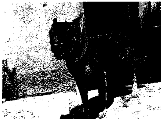
Fotografía 1. Canino motivo de denuncia.

En cuanto a su comportamiento, el canino respondía de manera favorable a la interacción con sus propietarios, por lo cual se infiere que no sufre de estrés por algún tipo de maltrato físico; sin embargo, se observó inquieto al no tener la movilidad necesaria, por lo que se requirió a la persona responsable del canino, a proporcionarle una correa de mínimo 2 m de longitud cuando este amarrado, además se le exhortó a no mantenerlo en la vía pública.