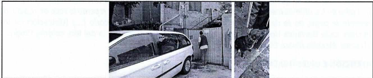
FOTOGRAFÍAS.- Vistas de la fachada del inmueble y del ejemplar canino motivo de investigación.

Finalmente, mediante el oficio correspondiente, se informó a la persona responsable del ejemplar canino objeto de investigación, las obligaciones que prevé la Ley de Protección a los Animales de la Ciudad de México al contar con un animal de compañía, conminándolo a su debido cumplimiento.