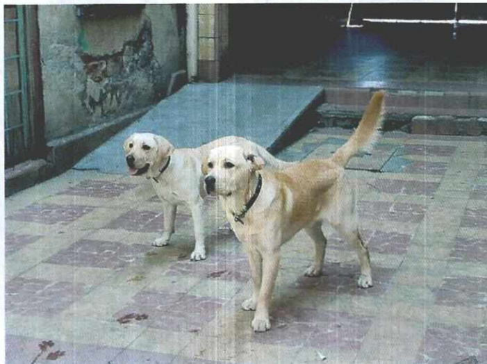
Fotografías.- Ejemplares caninos motivo de la denuncia.

PROCURADURIA AMBIENTAL Y DEL ORDENAMIENTO TERRITORIAL DE LA CDMX