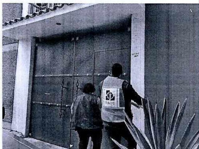
Imagen 2. Fachada del domicilio motivo de denuncia.

Es de resaltar que, con la finalidad de contar con información adicional respecto de los hechos denunciados, en el Acuerdo de Admisión, que fue enviado por correo electrónico a la persona denunciante, se le hizo de conocimiento que contaba con un término de seis días hábiles para aportar las pruebas que estimara pertinentes en la investigación de los hechos, lo anterior conforme al artículo 90 del Reglamento de la Ley Orgánica de la Procuraduría Ambiental y del Ordenamiento Territorial de la Ciudad de México; sin embargo durante el procedimiento de investigación, no fueron proporcionados elementos de prueba que pudieran determinar incumplimiento a la normatividad en materia de bienestar animal.