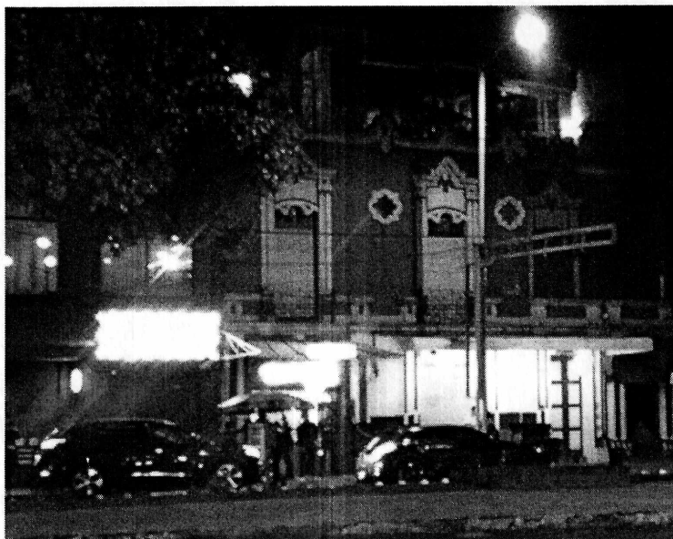
Fotografía 1. Vista de la fachada del establecimiento motivo de denuncia.

Por lo anterior, se hizo entrega de citatorio, con la finalidad de que el responsable del establecimiento se presentara a comparecer en las instalaciones que ocupa esta Procuraduría; en ese sentido, el propietario del local concurrió a la cita indicada por esta Entidad, acto durante el cual, mediante la promoción del cumplimiento voluntario de las disposiciones en materia ambiental contenido en el artículo 5 fracción XIX de la Ley Orgánica de esta Procuraduría, el compareciente se comprometió a implementar las medidas de mitigación de ruido necesarias, en caso de que, mediante estudio de ruido se comprobara que durante la operación del local que excedieran los límites establecidos en la Norma Ambiental NADF-005-AMBT-2013.