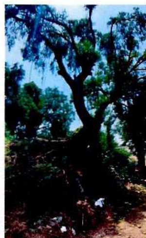
Imágenes 1-7. Individuos arbóreos vistos durante el recorrido.