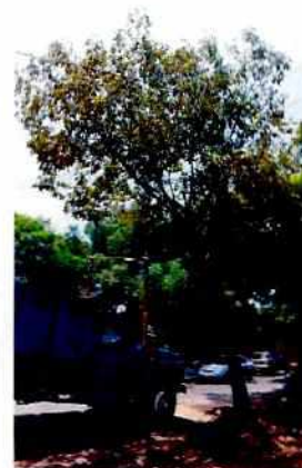
Imágenes 1-4. Individuos arbóreos vistos durante el recorrido.