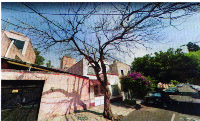
Imagen 1. Individuo arbóreo en el año 2019.

En este sentido, de las constancias que obran en el presente expediente, se desprende que personal de esta Subprocuraduría llevó a cabo una visita de reconocimiento de hechos, diligencia durante la cual nos constituimos frente al domicilio indicado en el escrito de denuncia, en donde se observó un poste de concreto colocado en donde en apariencia, anteriormente pudiera haberse erguido un árbol; en seguimiento a lo observado en la visita de reconocimiento de hechos, se realizó una búsqueda de imágenes del año 2019 en la plataforma informática Google Maps en donde se observa un individuo arbóreo comúnmente conocido como Jacaranda, la cual presenta una estructura sin follaje y seco.