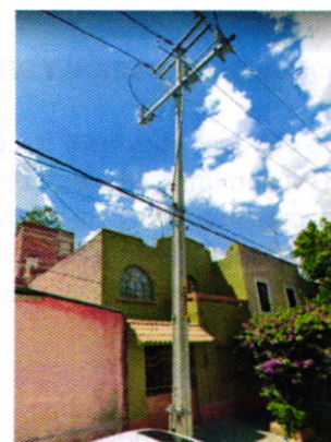
Imagen 2. Poste de luz actual.