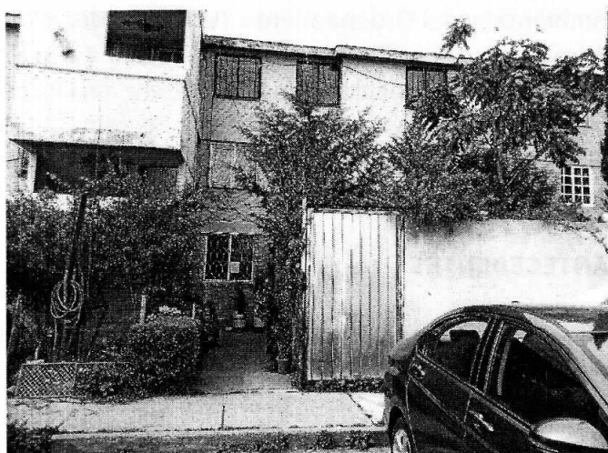
Fotografía 1. Fachada del sitio señalado como lugar de los hechos.

Asimismo, durante la diligencia se constató que el ejemplar canino en comento se encontraba amarrado a una cadena de aproximadamente un metro de longitud, no se percibieron recipientes con agua y el sitio contaba con residuos de heces y orina; por lo anterior, mediante oficio correspondiente, se le exhortó a la persona habitante del predio a realizar la limpieza del sitio, alargar la cadena con la cual mantiene amarrado al ejemplar canino y a proporcionarle agua de manera permanente. Respecto a los ejemplares felinos, la persona habitante del predio en comento señaló que desde hace varios meses no cuenta con ningún felino, toda vez que éste se escapó.