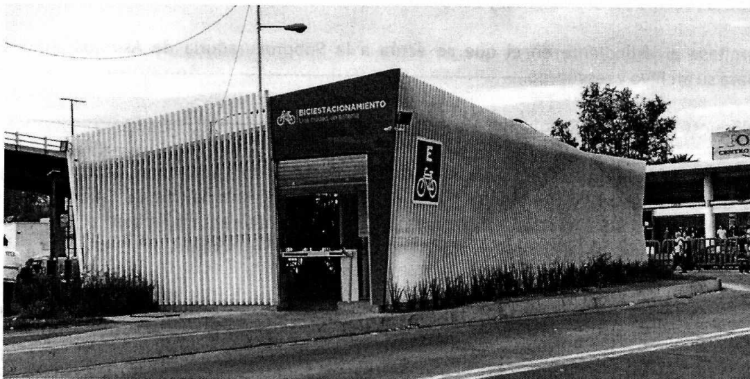
Fotografía 1. Biciestacionamiento ubicado en calle Jesús García, entre Eje 1 Norte y calle Carlos J. Meneses, colonia Buenavista, Alcaldía Cuauhtémoc.

No obstante lo anterior, en fecha 28 de noviembre de 2019, se tuvo por recibido un correo electrónico de la persona denunciante en el cual manifestó expresamente su desistimiento. Por lo anterior, considerando que no quedan actuaciones pendientes por parte de esta Subprocuraduría Ambiental, de Protección y Bienestar a los Animales para el caso que nos ocupa, se procede a dar por concluida la investigación de la denuncia ciudadana bajo el número de expediente citado al rubro, con fundamento en el artículo 27 fracción IV de la Ley Orgánica de la Procuraduría Ambiental y del Ordenamiento Territorial.