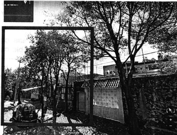
GOOGLE VIEW STREET DICIEMBRE 2014

Al realizar la comparación de la información obtenida vía internet y lo constatado mediante reconocimiento de hechos se tiene lo siguiente: -----