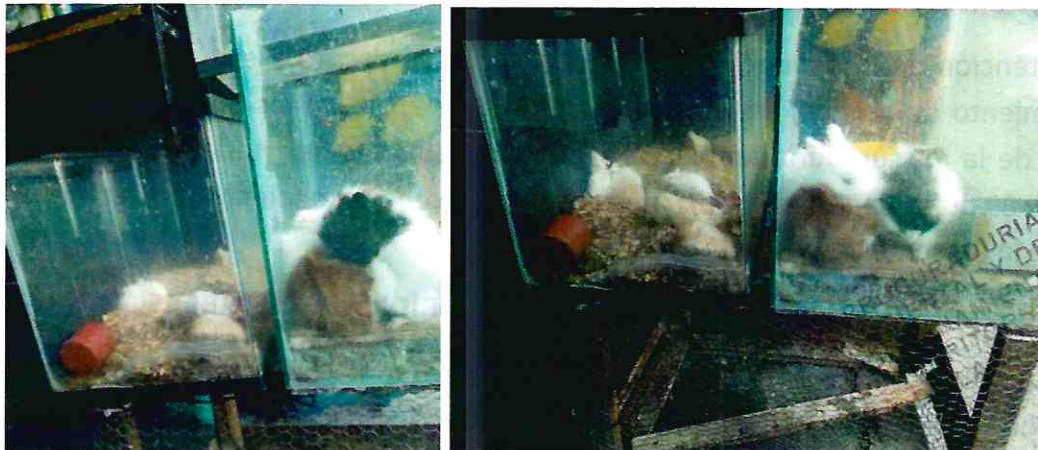
Fotografías.- vista de algunos de los ejemplares que se encontraban en exhibición para la venta