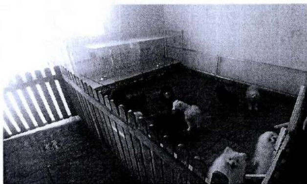
Ejemplares Pomerania machos.

En relación con la condición corporal de todos los cánidos, es ideal, de acuerdo a su raza, talla y edad, toda vez que sus costillas son fácilmente palpables, con mínimo recubrimiento de grasa, además de que se observaron sus cinturas detrás de las costillas al ser vistos desde arriba, así como un pliegue abdominal evidente.