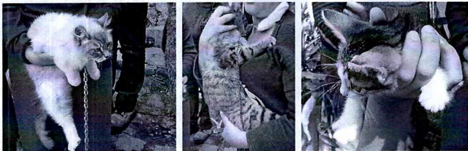
FOTOGRAFÍAS.- Vista de los ejemplares felinos

No obstante, mediante oficio se hizo del conocimiento del responsable de los ejemplares felinos, las responsabilidades que se tienen que cumplir al tener animales de compañía, conminándolo a su debido cumplimiento.