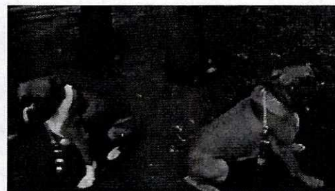
Fotografía 5. Entrenamiento canino.

Derivado de lo anterior, y no quedando actuaciones pendientes por parte de esta Subprocuraduría Ambiental, de Protección y Bienestar a los Animales para el caso que nos ocupa, se procede a dar por concluida la investigación de la denuncia ciudadana bajo el número de expediente citado al rubro, con fundamento en el artículo 27 fracción III de la Ley Orgánica de la Procuraduría Ambiental y del Ordenamiento Territorial de la Ciudad de México.