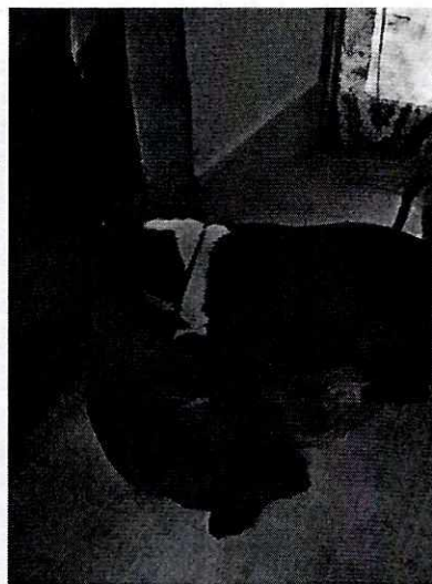
Fotografía 4. Caninos durmiendo al interior del inmueble.