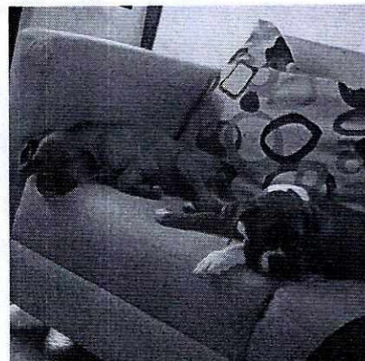
Fotografía 1 y 2. Muestra a los ejemplares caninos desde cachorros, y con acceso al interior del inmueble.