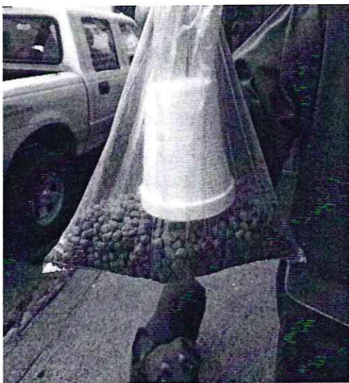
Fotografía 3. Alimento del ejemplar canino.