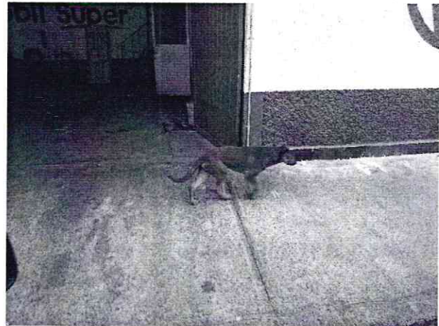
Fotografía 1. Ejemplar canino motivo de denuncia. Fotografía 2. Ejemplar deambulando libremente.