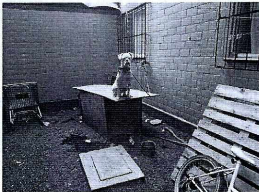
Fotografía 1. Muestra lugar de alojamiento del ejemplar canino.