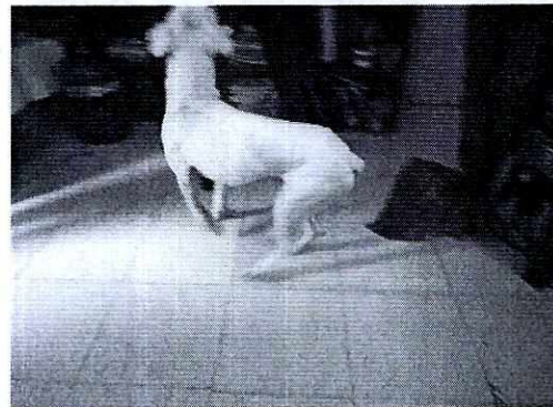
Fotografía 2. Canino con condición corporal delgada.