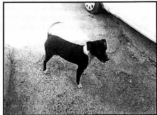
Imagen. Ejemplar canino de nombre “Tiki tiki”

En seguimiento a la denuncia, se realizó una nueva visita de reconocimiento de hechos en la cual no se constataron a los ejemplares caninos en la vía pública; en el mismo acto se intentó tener comunicación con los propietarios de los cánidos sin embargo nadie atendió el llamado, por lo que se procedió a notificar el exhorto número PAOT-05-300/210- 2172 -2019.