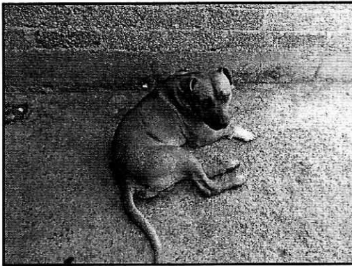
Imagen. Ejemplar canino de nombre “Jonás”