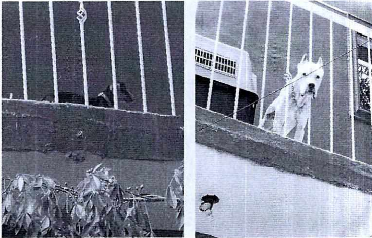
Fotografías 1 y 2.- Ejemplares caninos de raza bóxer y salchicha, motivo de los hechos denunciados.

donde se hicieron de conocimiento las obligaciones referidas en cuanto los cuidados de bienestar animal que debe proporcionarle a sus ejemplares caninos.