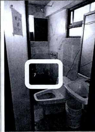
Área donde se ubica la compresora

Por todo lo antes expuesto, el 9 de diciembre de 2019 personal investigador a cargo de la denuncia sostuvo comunicación vía telefónica con la persona denunciante, quien al respecto manifestó que dejó de percibir las emisiones sonoras derivadas de las actividades que se realizan en el inmueble en comento, toda vez que dijo tener conocimiento que quienes realizan dichas actividades acuden al sitio denunciando espontáneamente y que se colocó una lámina en la azotea del inmueble por lo que tampoco percibe olores.