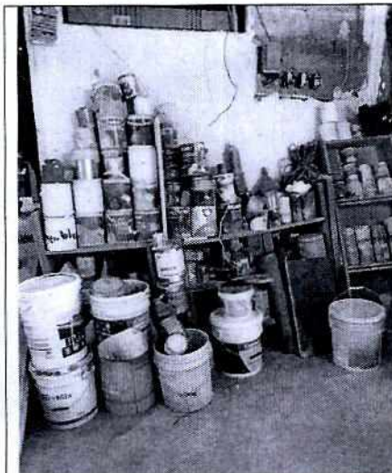
El inmueble cuenta con características propias de un taller/bodega