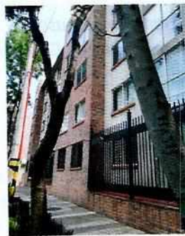
Imagen del sitio motivo de la denuncia

En seguimiento; la persona denunciante, mediante una llamada telefónica, informó que los ejemplares caninos que motivaron la denuncia ya no habitaban en el lugar, por lo que los hechos que motivaron su denuncia dejaron de existir.