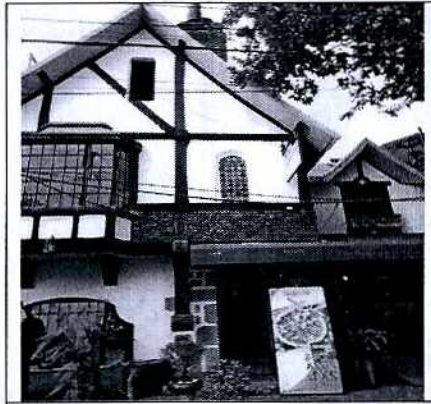
Establecimiento mercantil denunciado.

Al respecto, el 15 de octubre de 2019 personal adscrito a esta Subprocuraduría llevo a cabo un reconocimiento de hechos en calle Xicoténcatl, número 384, colonia Del Carmen, Alcaldía Coyoacán, ubicando el establecimiento mercantil denominado "BRAVISSIMO" que al momento de la diligencia se encontró en funcionamiento; asimismo, no se percibieron emisiones sonoras desde la vía pública, no obstante, se dejó el oficio citatorio PAOT-05-300/200-11016-2019.