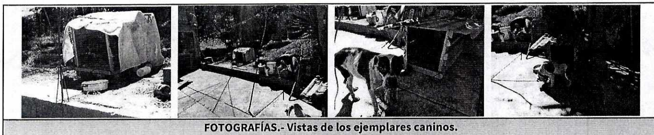
FOTOGRAFÍAS.- Vistas de los ejemplares caninos.

No obstante lo anterior, mediante el oficio correspondiente, se informó a la responsable de los ejemplares caninos objeto de investigación, las obligaciones que prevé la Ley de Protección a los Animales de la Ciudad de México al contar con animales de compañía, conminándolo a su debido cumplimiento.