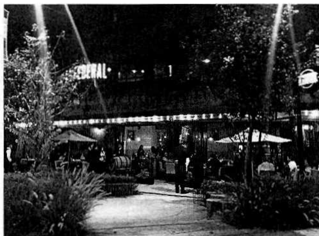
Figura 1. Vista del establecimiento motivo de denuncia.

No obstante lo anterior, personal adscrito a esta Subprocuraduría llevó a cabo una nueva visita de reconocimiento de hechos, durante el cual desde la vía pública se constataron emisiones sonoras provenientes del establecimiento motivo de denuncia; hechos por los cuales personal de la Dirección de Estudios, Dictámenes y Peritajes de Protección Ambiental de esta Entidad, llevó a cabo una medición sonora desde el domicilio de la segunda persona denunciante; durante la cual se constató que en las condiciones de operación presentes durante la visita en que se practicó dicha medición, transmitía al punto de medición un nivel sonoro de 65.17 dB(A), el cual excede los límites máximos permisibles de recepción de ruido de 62 dB (A) para el horario de las 20:00 horas a las 06:00 horas, establecidos en la Norma Ambiental para el Distrito Federal NADF-005-AMBT-2013.