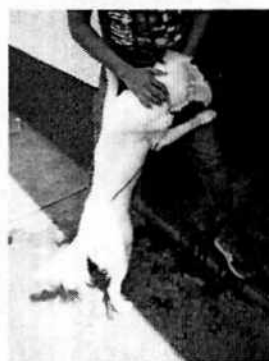
Fotografías 1-2. Vista del ejemplar canino.