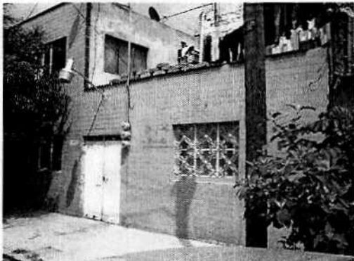
Fotografía 1. Vista del inmueble señalado como el lugar de los hechos.

En este sentido, de las constancias que obran en el presente expediente, se desprende que personal de esta Subprocuraduría llevó a cabo dos visitas de reconocimiento de hechos, de acuerdo a lo establecido en el artículo 15 BIS 4 fracción IV de la Ley Orgánica de esta Entidad, diligencias durante las cuales no se encontró a la persona propietaria del ejemplar motivo de denuncia, no obstante el personal actuante tuvo comunicación con un familiar de dicha persona, quien informó que dicho canino ya había fallecido, a pesar de que tuvo atención médico veterinario; no obstante lo anterior, se notificaron dos citatorios correspondientes, mismos que no fueron atendidos.