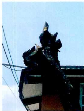
Imagen 1-3. Jacaranda ( Jacaranda mimosifolia ) afectada, motivo de denuncia.